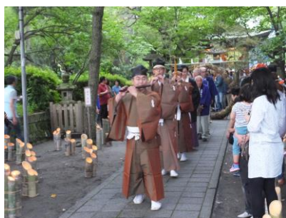
6月24日(土) "あかりともるよる" at. 三保松原 出演